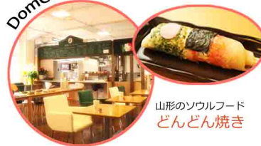
山形のソウルフード とんとん焼き