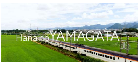
オープニング 約30秒の花笠PR動画

TEL:023-642-8753 / FAX:023-622-4668 Email: chiiki@yamagata-cci.or.jp