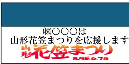
エンディング(上段:貴社の画像 下段:花笠まつりロゴ)